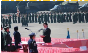
自衛隊60周年の『60』を航空飛行で描いています。かなり、高度な飛行技術が必要とのことでした。

☆航空観閲式事前公開 10月19日(日) ～航空自衛隊 百里基地～ 当日は天候に恵まれ、観覧日和となりました。翌週が航空観閲式本番とのことでしたが、普段観ることのできない展示物等もあり、素晴らしい内容でした。